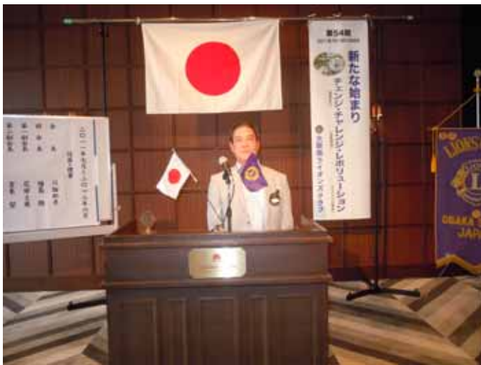
L 向山 ご挨拶