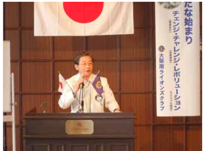
L 児島 年間予算発表