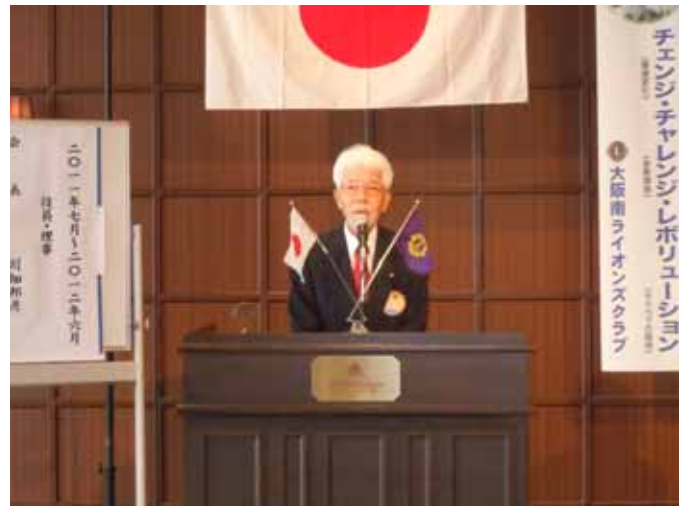
L 目黒 ご挨拶