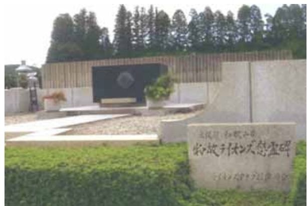
物故ライオンズ慰霊碑 高野山