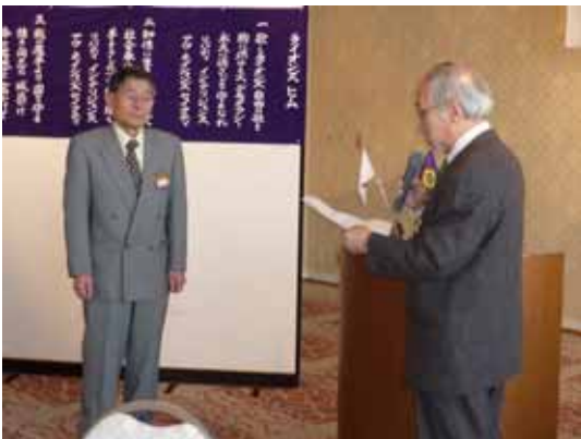
2007~2008年クラブ会長優秀賞し福島