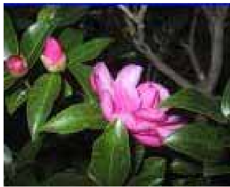
季節の花 山茶花(さざんか)