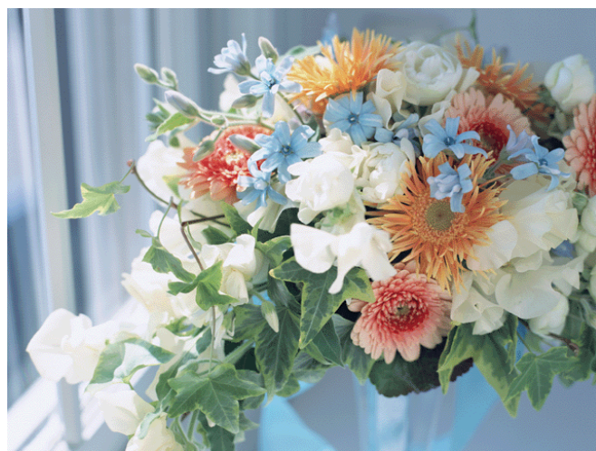
ガーベラ スイートピー アイビー ブルースター