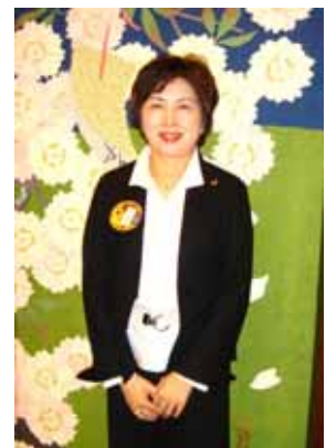
社会奉仕 「ふれあいセンター もも」に車両を贈呈